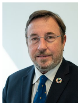
署长阿希姆·施泰纳 (Achim Steiner) 联合国开发计划署 (UNDP)

我邀请大家查看该策略,了解更多信息。在联合国大家庭合作伙伴的支持和协作及其他努力下,包括我们与联合国妇女署的密切伙伴关系,开发署将继续与各国和社区一道采取行动,扩大人们的选择范围,实现一个公正和更平等的世界。