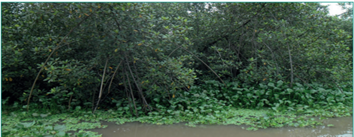
Restauration de mangrove à Anan, Bingerville

Gestion durable des écosystèmes littoraux : plus de 200 ha de mangroves restaurés.