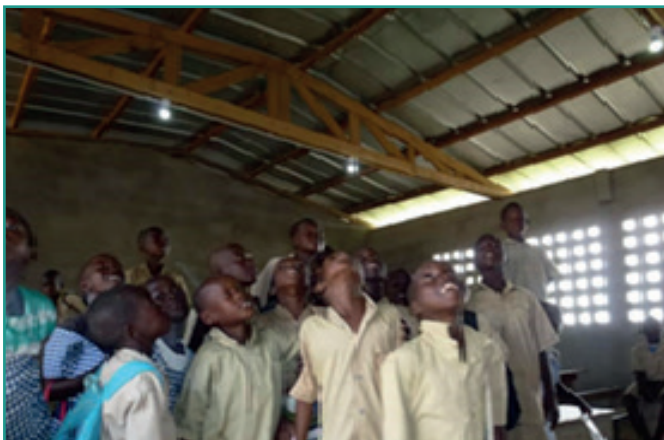
Electrification de classe par système solaire à Koukouedou, Divo

Accès aux énergies renouvelables : Près de 6,000 ménages et infrastructures de bases en milieu rural ont accès à l'électricité et à l'eau potable par des systèmes solaires.