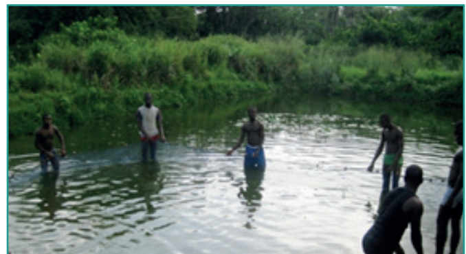
Pisciculture à base d'aliments naturels à Grand-Bassam

Agriculture/Pêche durable et sécurité alimentaire : des pratiques responsables et durables ont été développées par les communautés locales : agro-écologie, agroforesterie, emploi de bio-pesticides et bio-engrais, réduction de l'utilisation des produits chimiques dans la pêche et l'agriculture.