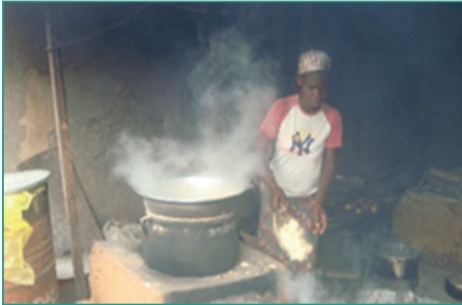
Foyer amélioré pour cuisson d'attiéke à Yopougon-Kouté

Gestion des ressources ligneuses : Plus de 10,000 foyers améliorés diffusés aux ménages à faibles revenus en zone rurale et urbaine en vue de la réduction de la destruction des ressources ligneuses.