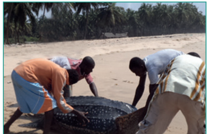
Projet de protection torture marine à Grand-Berreby

Gestion durable des écosystèmes littoraux : plus de 200 ha de mangroves restaurés.