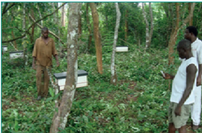
Protection de relique forestière par l'apiculture à Toumodi

Biodiversité terrestre et marine : Grâce du PMF/FEM, ce sont plus de 200 km 2 de forêts galeries et 1,500 ha de reliques forestières qui ont été protégées, et plus de 250 tortues marines adultes et près de 50,000 bébés tortues qui ont été protégés par saison ;