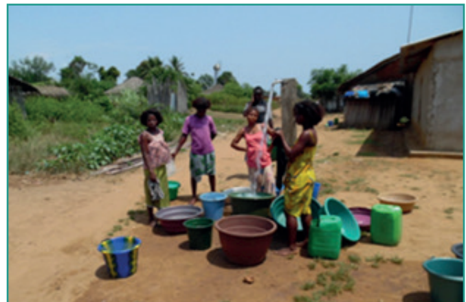
Fourniture d'eau potable par un système solaire à Mani Grand-Bereby

Agriculture/Pêche durable et sécurité alimentaire : des pratiques responsables et durables ont été développées par les communautés locales : agro-écologie, agroforesterie, emploi de bio-pesticides et bio-engrais, réduction de l'utilisation des produits chimiques dans la pêche et l'agriculture.