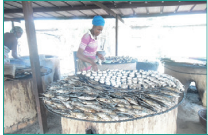
Fourneau amélioré pour fumage de poisson à Abobo

Accès aux énergies renouvelables : Près de 6,000 ménages et infrastructures de bases en milieu rural ont accès à l'électricité et à l'eau potable par des systèmes solaires.