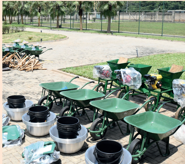
Vue partielle des équipements et matériels offerts aux agripreneurs

Ce projet, porté par la Fondation (SEA) et financé par le Programme des Nations Unies pour le développement (PNUD) en collaboration avec le ministère de l'agriculture, incarne l'engagement envers l'agriculture durable. Elle démontre que l'investissement dans la formation et le soutien aux jeunes agriculteurs est un pas vital vers la sécurité alimentaire, le développement durable, la réduction de la pauvreté, une croissance économique durable, la création des opportunités pour les communautés rurales et le renforcement de la résilience des communautés.