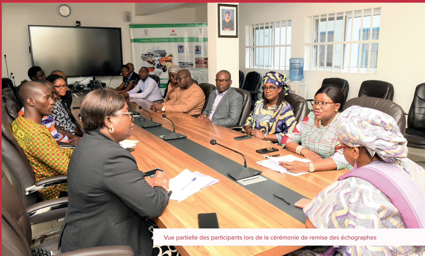
Vue partielle des participants lors de la cérémonie de remise des échographes