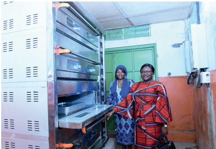
Parmi la multitude d'équipements offerts par le PNUD, un immense four

Déterminée à se lancer dans la ZLECAf dans le respect des normes de certifications, l'entreprise a entamé une lancée vers les procédures de normalisation de la chaîne de production en réaménageant le site de production suivant les normes de l'ITRA et de l'HACCP, sans oublier la traçabilité de la matière première assurée par l'ITRA et l'ICAT.