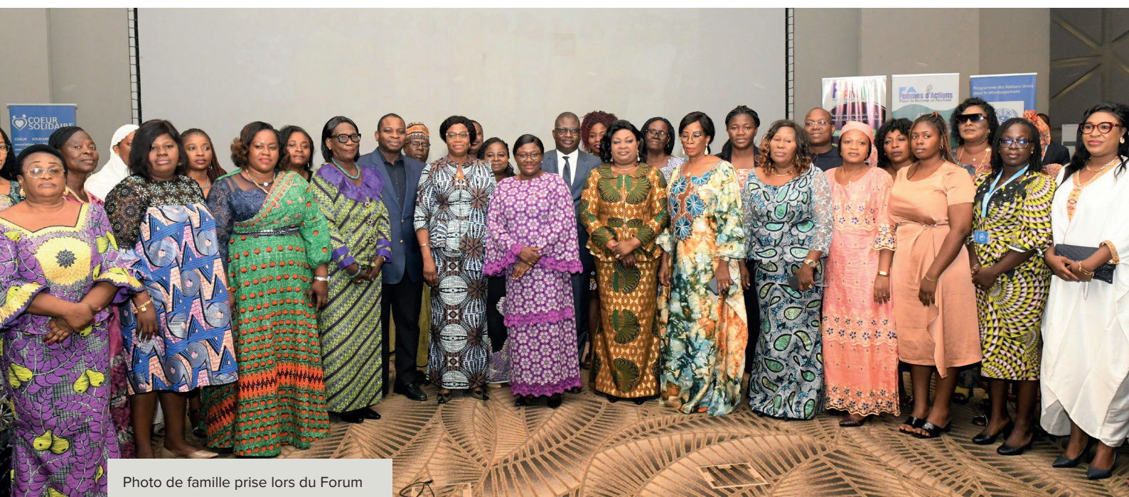
Photo de famille prise lors du Forum

Placé sous le thème : « Inclusion numérique et violences basées sur le genre (VGB): freins, opportunités et défis », le Forum a été organisé par les associations Femmes d'Action et Cœur Solidaire avec l'accompagnement technique et financier du PNUD . Il s'inscrit dans le cadre des activités de la Journée internationale de la femme africaine célébrée le 31 juillet dernier.