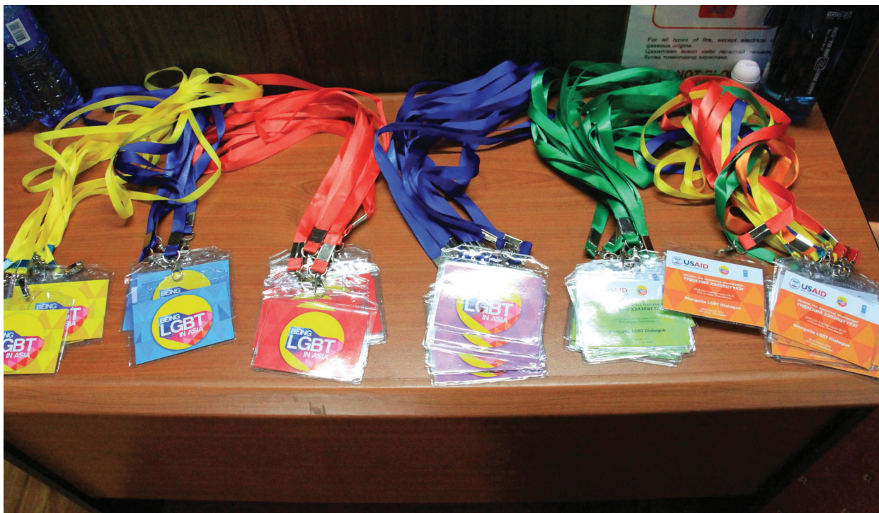
Оролцогчдыг 6 сэдвээр дэд бүлэгт хуваахын тулд өнгөт зүйлд ашиглав

Монгол Улсын Үндсэн хуулинд эрэгтэй, эмэгтэй хүмүүс гэр бүл болохыг л гэрлэлт гэж тодорхойлсон (16 дугаар зүйл) тул ижил хүйсийн болон хүйс заагаагүй гэрлэлтийг хүлээн зөвшөөрдөггүй. Хуулийн энэхүү заалт нь ижил хүйсийн хос эсрэг хүйсийн хосын адил тэгш эрх эдлэхэд саад болж байгаа юм (ХЭҮК, 2013). Гэрлэлтийн тэгш эрх хангагдаагүй тул гэрлэсэн хосод хамаарах эрх, халамж, дэмжлэгийг ижил хүйсийн хосууд хүртдэггүй. Тухайлбал, гэрлэсэн эр эм хос хүүхэд үрчлэн авч болдог. Интерсекс олон нийтийн төлөөлөл болох нэг хүн дараахь асуудлыг хөндсөн байдаг.