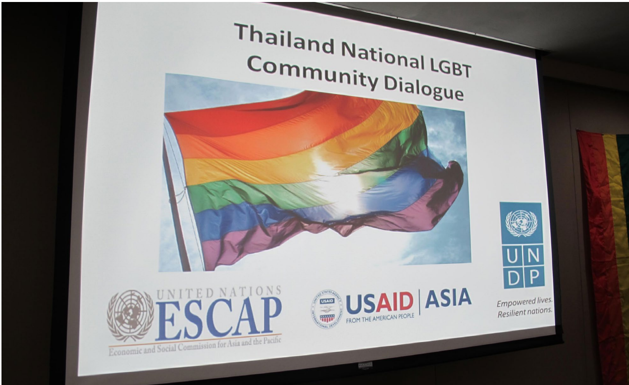
จอภาพแสดงสัญลักษณ์งานเสวนากลุ่ม LGBT แห่งประเทศไทย