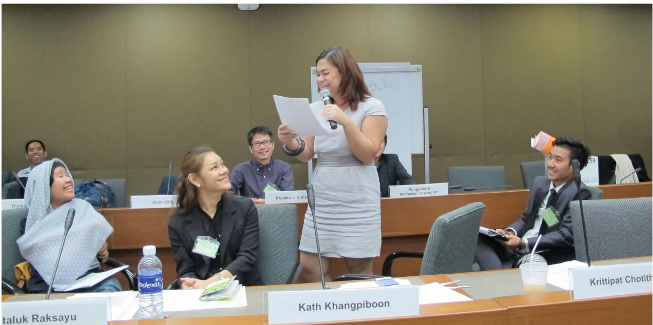
ผู้เข้าร่วมประชุมนำเสนอข้อค้นพบและข้อเสนอแนะในงานเสวนา

ในส่วนต่อไปนี้จะกล่าวถึงภาพรวมของการปกป้องสิทธิของชาว LGBT ซึ่งจะแบ่งออกเป็น 6 ส่วนย่อยด้วยกัน ได้แก่ การจ้างงานและสิทธิว่าด้วยเรื่องที่อยู่อาศัย การศึกษาและเยาวชน สุขภาพและความเป็นอยู่ที่ดี ความสัมพันธ์ของคนในครอบครัว และทัศนคติทางสังคมและทางวัฒนธรรม สื่อและเทคโนโลยีสารสนเทศ และความสามารถขององค์กรที่ทำงานเพื่อชาว LGBT