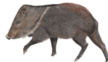
Pecari de Collar ( Pecari tajacu ) Kasirí