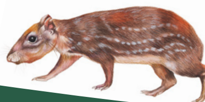
Tepezcuintle ( Cuniculus paca ) koño