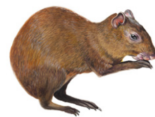
Guatusa ( Dasyprocta punctata ) Shulék