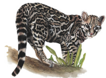
Cauce ( Leopardus wiedii ) Namá