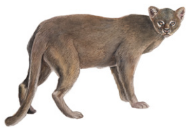
Yaguarundí ( Puma yagouaroundi ) Namá dolóná silá naméi