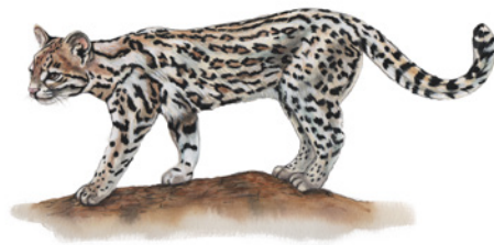
Tigrillo ( Leopardus triginus ) Namá kitèle