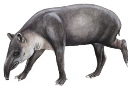
Danta ( Tapirus bairdii ) Naí