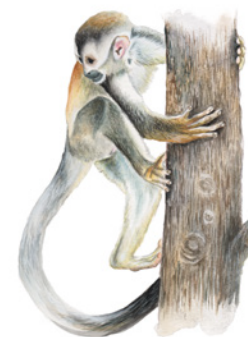
Mono Titi ( Saimiri oerstedii ) Kus