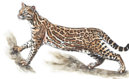
Manigordo ( Leopardus pardalis ) Namá duletkalo