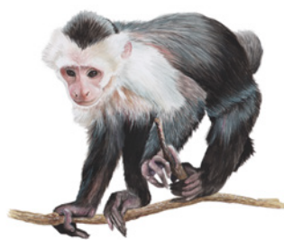
Mono Cara Blanca ( Cebus imitador ) Jok