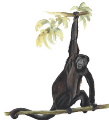
Mono Congo ( Alouatta palliata ) Dake