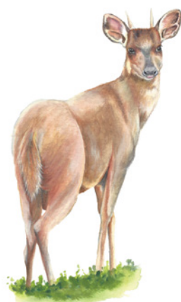
Cabro de Monte ( Mazama temama ) Dawe