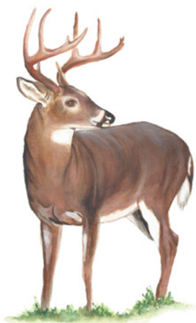
Venado Cola Blanca ( Odocoileus virginianus ) Mulubí