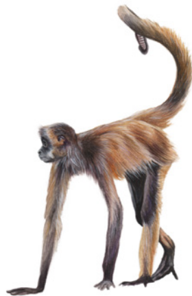
Mono Araña ( Ateles geoffroyi ) Sál